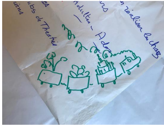
Premier schéma du carnaval trouvé dans les archives du journal daté peut être du 11 décembre 2018

Il mobilisera les artistes et les artisans du territoire, les jeunes et les adultes autour de compétences partagées pour concevoir les chars (avec des imprimantes 3D et des graphes), proposer des musiques numériques déjantées, développer des jeux de société et des animations, créer des spectacles de rue participatifs avec les club de théâtre et des musiciens et concevoir des jeux de lumières numériques.